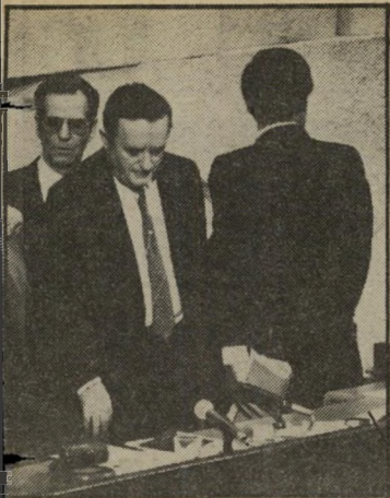
חוזר סבידור מתכוון להת- יישב על כיסאו, וסדרן הכנסת מניח כרית בנב המושב.