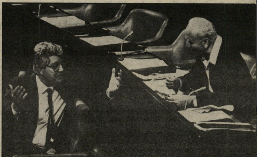
„מה לעשות?“ סגן-ראש-הממשלה, דויד לוי, מנהל שיחה ערה עם מונל- ההסתדרות ירוחם משל, בעיצומו של הדיון בשעות אחר- הצהריים. משל ישב כל הזמן במקומו הקבוע ולא זז ממנו. לוי, לעומתו בילה במיוזון.