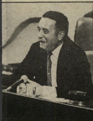
מחליט יושב-ראש הכנסת מודיע על החלטתו לקיים הצבעה גלויה, ולא חשאית.