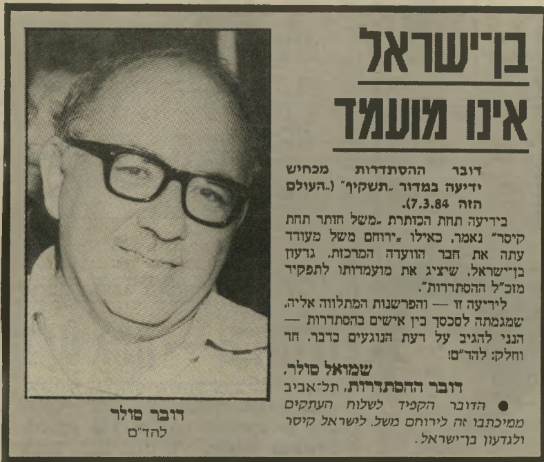
דובר סולר להד"ם

דובר ההסתדרות, תל-אביב ● הדובר הקמיד לשלוח העתקים ממכתבו זה לירוחם משל. לישראל קיסר ולגדעון בני-ישראל.