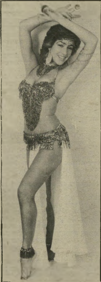
רקדנית סימון תועלת מירסומית

במדור "לילות ישראל" (העולם הזה 7.3.84) נשמט שמה של רקדנית-הבטן.