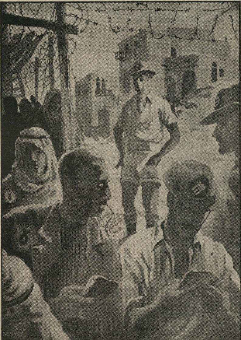
"אחריו בנימין": איור של שמואל בק (דיכוי ערבים) לפני 29 שנים והיום