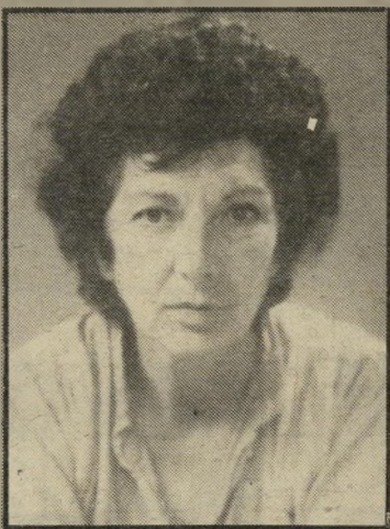
בימאית צ'לטון תחליף דהוי למייקל אלפרדס

בכל תרבות מצויות בעונות תרבותיות, המצליחות להישרד באורח בלתי-מוכן, חאת למרות שערכם התרבותי שואף לאפס, כנוף התיאטרונים הישראליים. גדולת הבעיות היא הבימאית האמריקאית נולה צ'לטון, שהצליחה במהלך העשור האחרון לחסל, מבחינת נושאי הטיפול התיאטרוניים, כל נושא ישראלי אפשרי, החל מנושא הדת, וכלה במרד הימאים.