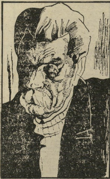
סוסרימחזאי גורקי תחזית-רעב לדור הווידוא

קריאת בשפל היא כנחיתה פעולת-תגמול של העוני בעושר, לא רק ברסיה הצארית, אלא ככל חברה של פערים בלתי-מגושרים בין עוני ועושר. עלילת בשפל המתרחשת במיקלט לילה לעניים חסרי-כית, מציגה את העוני על ניוולו המחולט. בשפל הוא כנחיתה התופת של העוני. שם