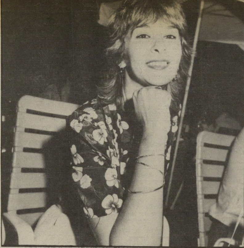
אוהרת אלוני בלונדית בתאונה

באונת'דרכים. המכונת נחבלה קשות ויצאה מכלל שימוש. הפועל, בחוברת תקציב מרכז הפועל לשנת 1983-84, אשר חולקה בימים אלה בכל סניפי הפועל ברחבי הארץ, בסעיף 7: ● המרכז (הפועל) קורא לרשויות המקומיות להגביר את תמיכתן באגודות הספורט במקומותיהן. ● המרכז רוחה בתוקף את המגמה של מיספר רשויות מקומיות להקים בתחומן אגודות ספורט או מיסגרות אחרות, המתחרות באגודות הספורט הקיימות. מצד אחד, מעודד מרכז הפועל תמיכה כספית בספורט, אך חלילה מלתמוך באגודות חדשות. נראה כי כל תמיכה שתקבל באהרה, בעיקר אם היא ניתנת להפועל.