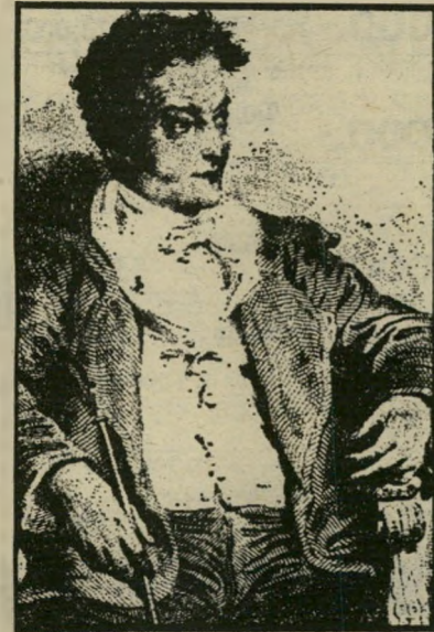
סופר את'א הוסמן עד המוות המר

כבר פתיחת הקטע מעידה על כיוונו: לפני שנים רבות, הרחק-הרחק בארץ מיורדה-השמש, חי לו איש צעיר לימים... הוא יקינתון, ובין העלמות היתה: אחת נפלאה למראה, יפה כתמונה. צבעה בצבע הדינג הבחיר... היא ורדינה. יקינתון יוצא למסע לארצות רחוקות, בעוד ורדינה מסתגרת בחדרה, עד שהוא מגיע אליה — אל הבתולה השמימית. פרשה ספרותית מרתקת מתרחשת בחלק השני של הפרח הכחול, הלא הוא גורלו ומותו של הכורה מפאלון. בחלק זה מביא טנאי חמש יצירות, שכולן עוסקות בגורלו ומותו של הכורה מפאלון. מקרה זה הוא מקרה נדיר, שהתרחש בשוודיה לפני 200 שנה, כאשר כורה צעיר, שנקבר במפולת מיכרה, נמצא כעבור 50 שנה, כשהוא חנוט. תגלית זו היוותה מקור השראה לסופרים ומשוררים גרמניים רבים, שעיבדו