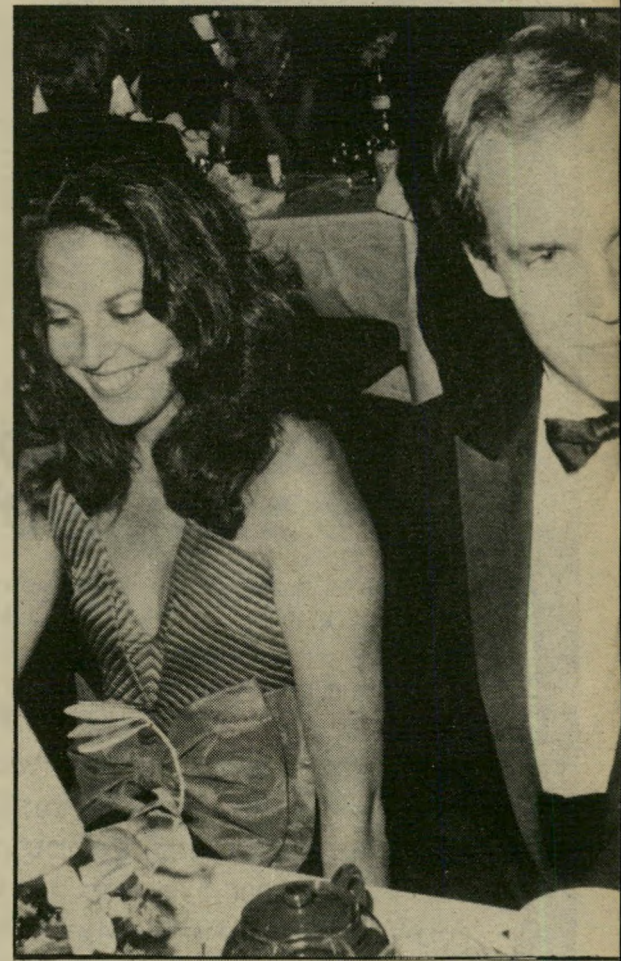
אלברט ממונאקו: החיך המאושר חזר לתקנו

כמה רחוק וכמה נשכח הוא היום הרומן האומלל של הנסיכה מארי אסטריד מלוכסמבורג עם הנסיך ציארלס מאנגליה . מי שהוכתרה כנסיכה העצובה, הפכה לנסיכה עליונה, אשה נשואה ואם מאושרת. בעלה, בריסטיאן לבית האבסבורג , הנחשב לאחד הנעמיים