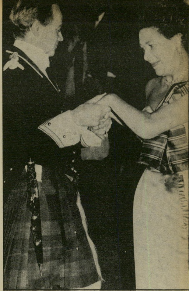
הנסיכה מארגרט: הריקוד האחרון

רחוק מן הארמוץ הסוער בילה לו צלם-החצר לשעבר לורד סנווארדן — הלא הוא טוני ארמסטרונג ג'ונס , בעלה לשעבר של הנסיכה מארגרט — בסוף שבוע פרוכנסאלי עם אשתו לוסי ובתם הקטנה פראנסס . טוני, הידוע לא רק בטעם טוב בצילום כי אם גם בטעם טוב ביון, בחר לו כמקום לחופשה את אחוזת וינילור שליך