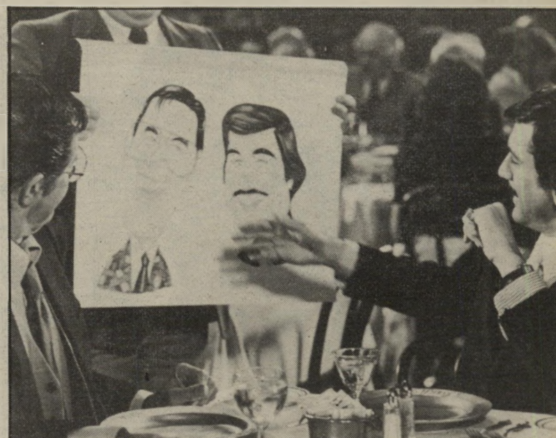
דהנירו ולואיס מתבוננים בדהנירו ולואיס ב-מלך הקומדיה מלכי הצחוק והדמע