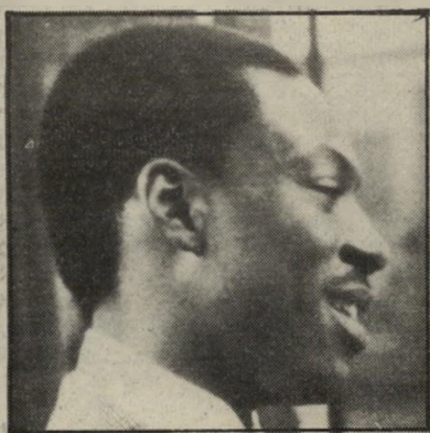
אדי מרסי ב-48 שעות תגלית עם עתיד

התסריט של אילמו גונאי אינו מתעלם משום פרט, אין הוא מנסה לייפות את המצב או להפוך את דמויותיו לגיבורים רומנטיים הפועלים נגד המימסר. הוא אפילו אינו מזכיר במפורש את הפוליטיקה, עוצמת הסרט טמונה דווקא בכך