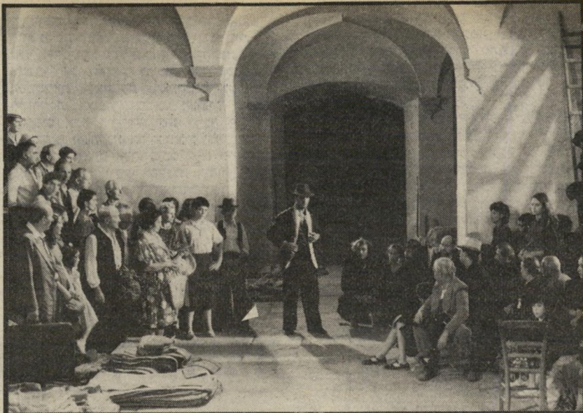
3. הלילה של סן-לורנצו (איטליה)