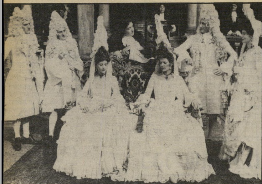
4. חוזה השרטט (אנגליה)