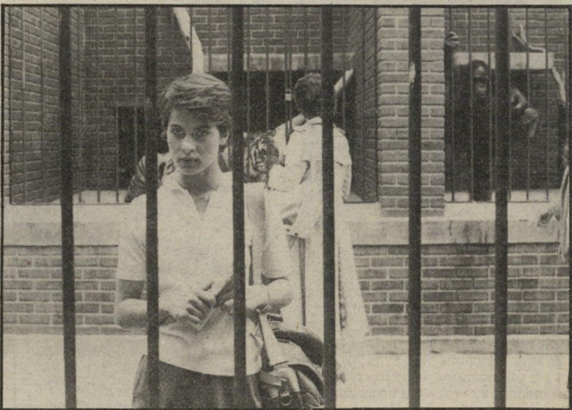
3. קללת אנשי החתול (ארצות-הברית)