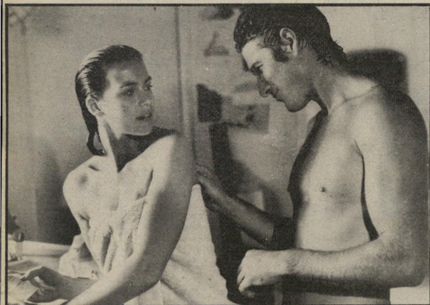
4. עד כלות הנשימה (ארצות-הברית)