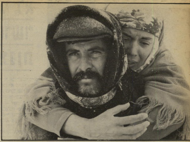
1. יול (תורכיה)