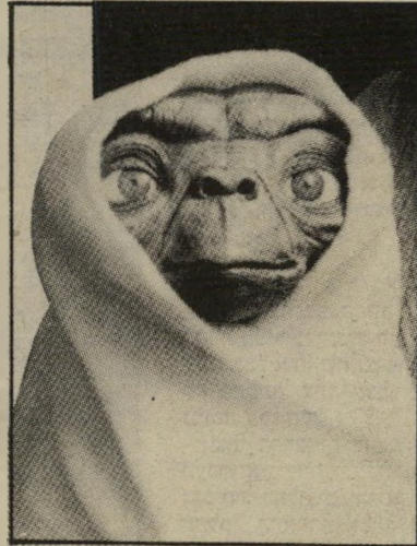
שחקן השנה איטי -איטי חבר מכוכב אחר

ב כאשר היתה ישראל אלופת-עולם (או כמעט) בשטח הצפיה כסרטים, לא ראו ישראלים כליכך הרבה סרטים, כמו שראו ש"ג. בולמוס אירי אחז אותם ואינם שבעים. הישראלים רואים סרטים באמצע הלילה נהרי היום, בשבתות ובחגים, ויש הרואים ילו שניים-שלושה סרטים ביום. אנשים יושבים ברעם — שפעם היו מתפנים אחת גבווע. במקרה הטוב, כדי לבקר בבתי-קולנוע, אז בוחרים את הסרט בקפידה — זוללים ה. סרטים בכל פה.