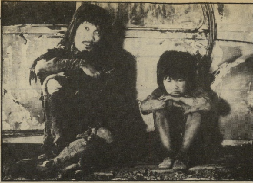
2. דודסקאדן (יפאן)