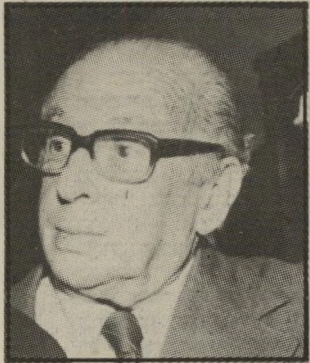
קורא סאמט אסט פאסט ניכט

בכותרת הראיון עם מינה צמח כתוב: "אסט פאסט נישט". בתוך הטכסט יש הערה שזו אמירה בשפת היידיש.