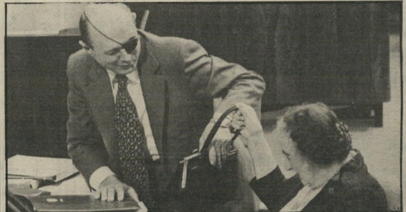
גולדה ודיין (מגישה לה את הארנק) בכנסת ברברן ופרימיטיבית

ישב משה ריין אי-פעם על תקן של אליל. כיום ברור לחלוטין שהוא היה ברברן, מתחכם זול, שמעולם לא אמר איך מילה אחת שהיו בה טעם ותבונה. בסך הכל נראה ריין כיום כאיש עלוב. פרימיטיבית ומטופשת, שחזרה בלי הרף על כמה פסוקים אינפנטיליים כלשון משוכשת. גם יגאל אלון נראה, במבט לאחור, כאדם רדוד וחסר-משקל. מי העז לאמר ב-1970 שמשעה ריין הוא אפס מנופוז שגולדה מאיר היא אשה פרימיטיבית? רק עיתון אחד במדינה: העולם הזה. ורק סיעה אחת בכנסת: זו שלנו. ועל כך שנאו אותנו, השמיצו אותנו, רדפו אותנו והחרימו אותנו. איך זה מתבטא בכתבה יוק. אין. עלידי גניזת חלק זה של ההווי שבין שתי המלחמות, הופכת אמת לשקר. מצטיירת תמונה נוחה: כולם טעו, כולם שגו. לא היה מי שהוהיר. אי-אפשר היה לדעת. כולנו הופתענו. הטלוויזיה עצמה, שקמה אחרי מלחמת ששת-הימים, מה היא עשתה כדי למנוע את האסון? כדי להזהיר ולהתריע? או, לפחות, כדי לאפשר למוזהרים ולמתריעים להשמיע את דבריהם?