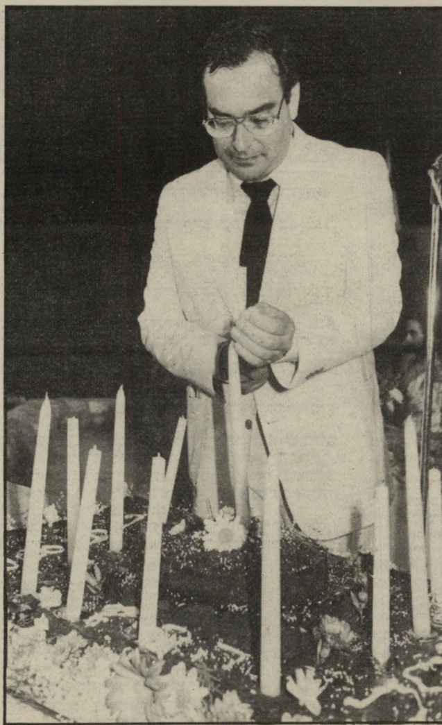
"מדיטציה" זהו מנהיגה של האגודה למדיטציה טראנסצנדנטי טלית בישראל, גד תיק. לאגודה יש בארץ שישה סניפים. והיא הגדולה והמעליחה שבין הכתות השונות הפועלות בישראל. לאגודה יש כמה אגודות מישנה, שתיק עומד גם בראשו.

בהקדמה לרוח הסודי, שהכינה ישרת ישראל על הכתות הפועלות ארץ, מוכהר האופי הפוליטי של מחקר. בעמוד 1' נאמר: במרוצת השנה האחרונה הופנו ממ"ן (מחלקת מודיעין-מחקר), יספר שאליות הקשורות לנושא כתות הדתיות ופעילותן בישראל. יסוף החומר לצורך מתן התשובות ינקל בקשיים, מאחר שהובר שכמעט א מצוי במישרת ישראל חומר ושא זה."