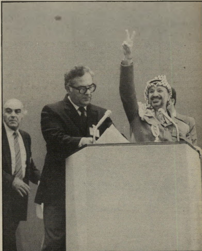
גאת י יאסר ערפאת הגיב בהרמת ידו באות-הניצחון על התשואות הסוערות שבהן התקבל לקראת תום נאומו מנה לעבר מלד ואבנרי ובירך במילים נרגשות את יחיות-השלום הישראליים. אחר-כך הזמין אותם לפגישה פומבית מאחורי הבימה.

משמע: אפשר לרמות קצת ולשקר קצת. אך כשהדופכים את זה לשיטה, מתגשי מת אימרתו של לינקולן: איי-אפשר לרמות את כל האנשים במשך כל הזמן. אבל אפשר לרמות חלק מן האנשים כל הזמן — ובמיקרה זה, את הציבור הישראלי. חלק מן העיתונאים הישראליים בשווייץ, ובראשם (כמו בכמה ארצות אחרות) רווקא כתבי דבר ועל המשמר,