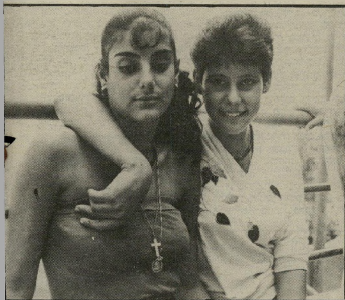
צלב זהב - הבחורות והבחורים הצעירים שברחו לג'זין עונדים, כמעט כולם, צלבי-זהב גדולים על החזה. למטה: חבורת צעירים פליטים המתאכסנים במינזר. הפליטות מאופרות.

כולם, משני הצדדים, טוענים כי המילחמה בשוף אינה מילחמה ערתית, כמו שמנסה התעמולה הישראלית להסביר, אלא מילחמת-מעמדות בין השמאל והימין. אסור היה לתת לפלאנגות להיכנס להרי השוף, הם