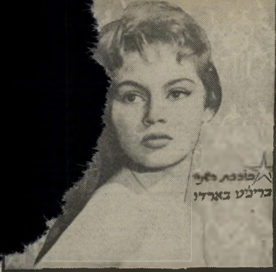
העולם הזה 1094. תאריך: 17.9.1958