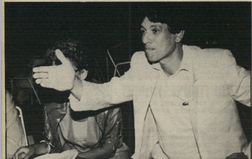
כתבת-רבות ארבל גניבה ספרותית!

ארבל התעלם מהתגוים המחייבים של מיסמך נקדי, המורה לכתבי טלוויזיה לציין בגוף הכתבה שימוש בקטעי ארכיון, ומקורותיו — בין