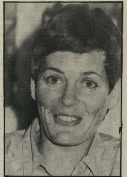
זמרת שרון השירים נגמרים

לומרת-פנתרנית שרהילה שרון על תוכניתה, שהיתה נקודת-האור היחידה של מישי