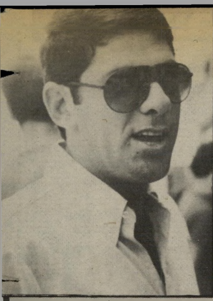
מאמן מליניאק אין מה להגיד

בחודש הבא יבואו האנגלים של וואטפורד, יחד עם ברטי מיל, למישחקי-דעם חוזר, הפעם כאיצטדיון רמת-גן. אוהדי הכדורגל הישראליים יוכלו להנות מנתח של כדורגל אנגלי ופיזיותאפיסטים ישראלים יוכלו להנות מנתח