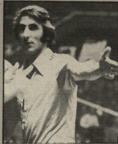
שומט עמית טוב בלי וליאמס

מערך שלא יהיה שינוי משמעותי ביחסי הכוחות. נראה לי, שאולי כבר גילערי תעלה בכמה נקודות, ואילו גלילעליון תילחם על המקום השלישי או הרביעי. מוקדם עדיין להעריך. גם מישחקי המבחן, שהיו עד עתה, לא מהווים קנה-מידה. אני בטוח שכל הקבוצות ייצטרפו השנה מנה גרושה של אורדרו עם נשימה ארוכה מתמיד."