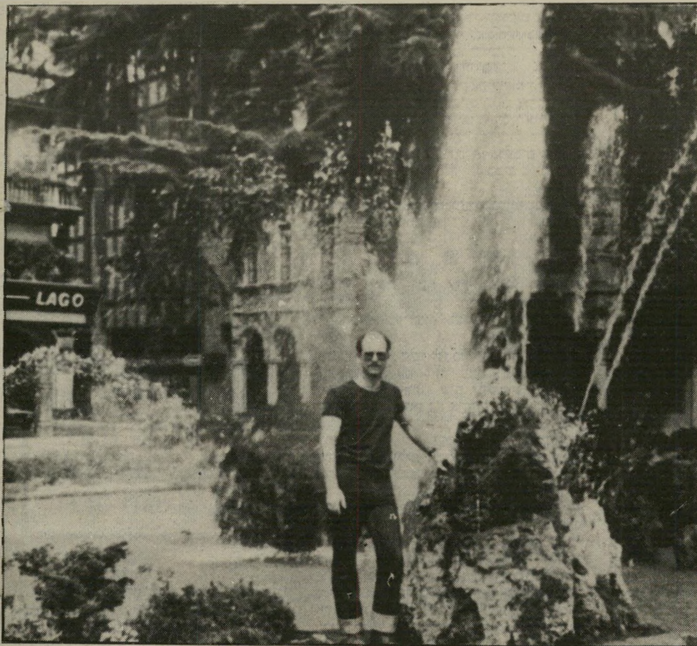
חרמון - כפי שצולם בירי הנרצחת טיול לחו"ל - עם אחרת

לנתק איתו את הקשרים. דווקא בזמן שהוא היה בחוץ לארץ, גילתה שהיא בהריון. כאשר חזר, סיפרה לו על כך. התגובה שלו היתה: "זה לא ממני, כי אני עקר". אחר-כך ניתקו את היחסים ביניהם.