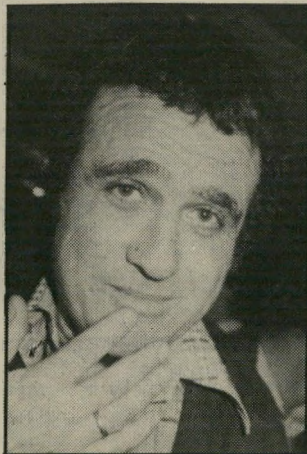
קורא גאון נעלב

כל הכבוד לשבועון. כנאמן לסיס מתו מזה מורה, ללא מורא, ללא משוא פנים, הוא קרע את המסווה — תרתי משמע — מעל ראשיהם הפוחחים של בעלי הפיאות בארצנו, שהסתובבו להם