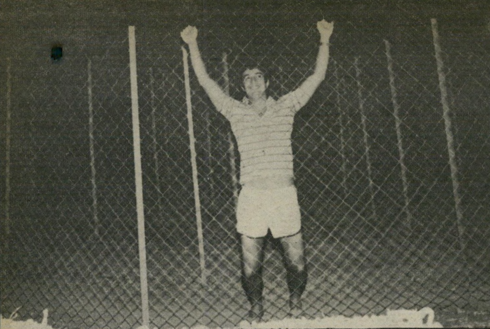
המבוכך של נויסלד. חיילים מן הגוד