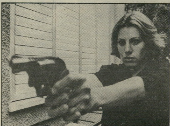
שומר-ראש מיקצועית. כולנו אוהבים עבודת ביטחון במיטווחת

הראש קיבלה על עצמה את המשימה. לפעמים מתנגדת אשת-יהלומן ששומר-ראש תאבטח את בעלה גם בשעות הלילה, בביתם. העיניים היפות של השומרת אשמות כזה.