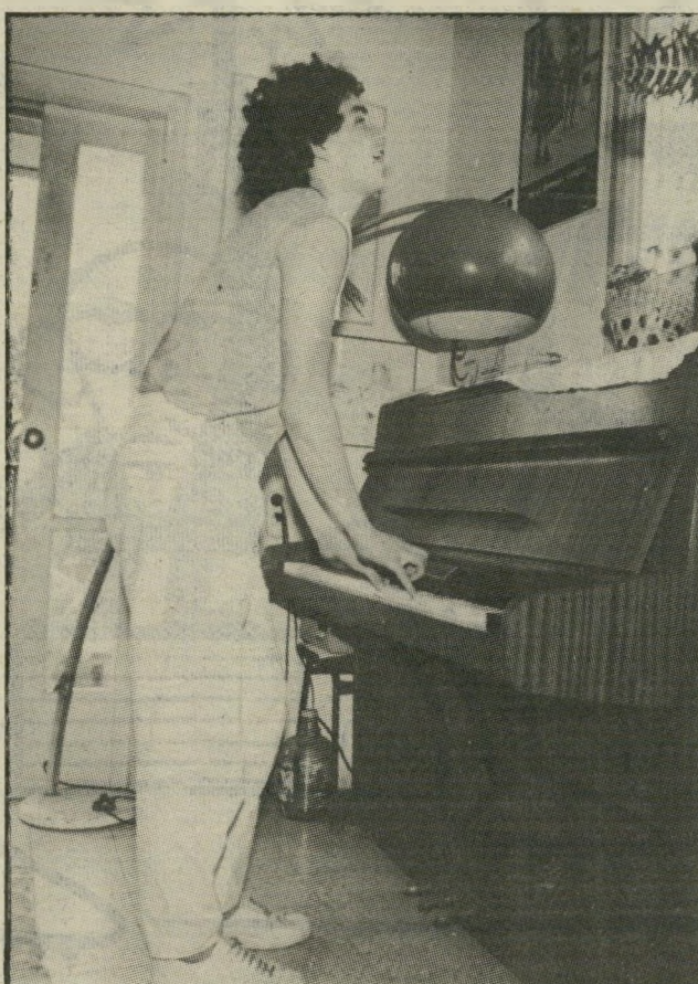
אשדות בנגינה לא ראינו לירה!

נורא קשה, היו לו כוחות על-אנושיים ממש. החברה שלו חלתה במחלה ממארת והוא בילה באולפן וכבית החולים נוי-סטופ. אני לא יודע איך הוא הצליח לעשות את זה.