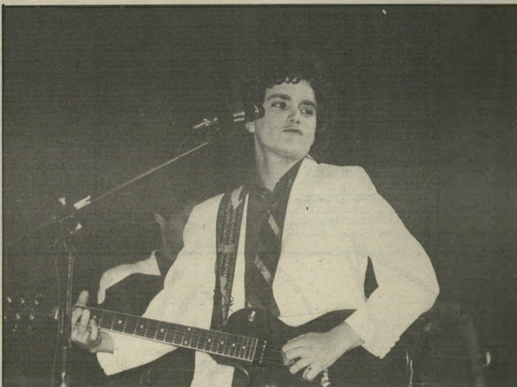
אשדות בסעולה אמרנו: הופה!

משבר נוראי, כל אחד בצורה אחרת. כשאני רואה את ההיסטריה הזו בעיתונים, בטלוויזיה וברדיו, אני אומר — רגע, אנחנו באמת מתפרקים או שזה תרגיל של יחסי ציבור. אני יודע שאם בנזין היתה מתפרקת, זה לא היה אותו סטוך. אני חי את עצמי 24 שעות ביממה. אני כותב כל הזמן. כתבתי שיר לאסתר שמיר. אני חושב שאני הולך לכיוון הפקה מוסיקלית. זה נעים מאוד להיות סטאר, אבל זה לא העיקר.