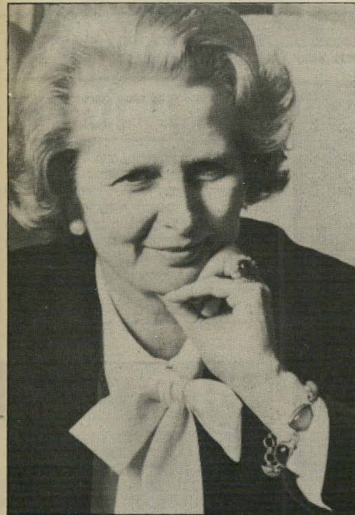
ראש ממשלה תאצ'ר תקיפה באורח אישי

משנה את המסר של סקארגיל, אך נוצלה היטב על-ידי עיתוני הימין, כדי לפגוע באמינותו.