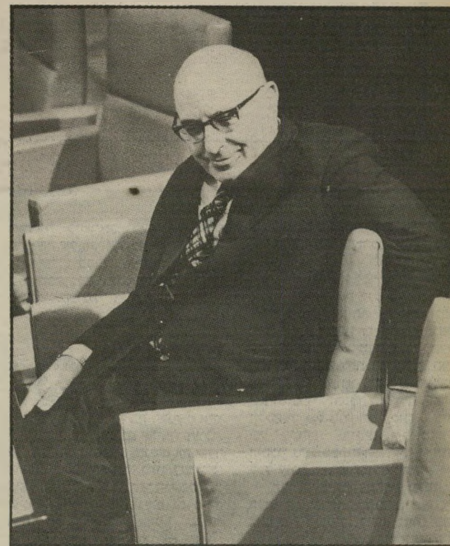
ממליך ספיר הפטרון טיפח צעירים