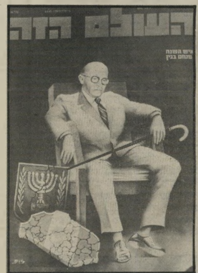
אישי-השנה תשמ"ג מיבחן

זהותו של איש-השנה מתבררת במשך זמן רב. למעשה, כבר בעונת-הפסח מתחילות