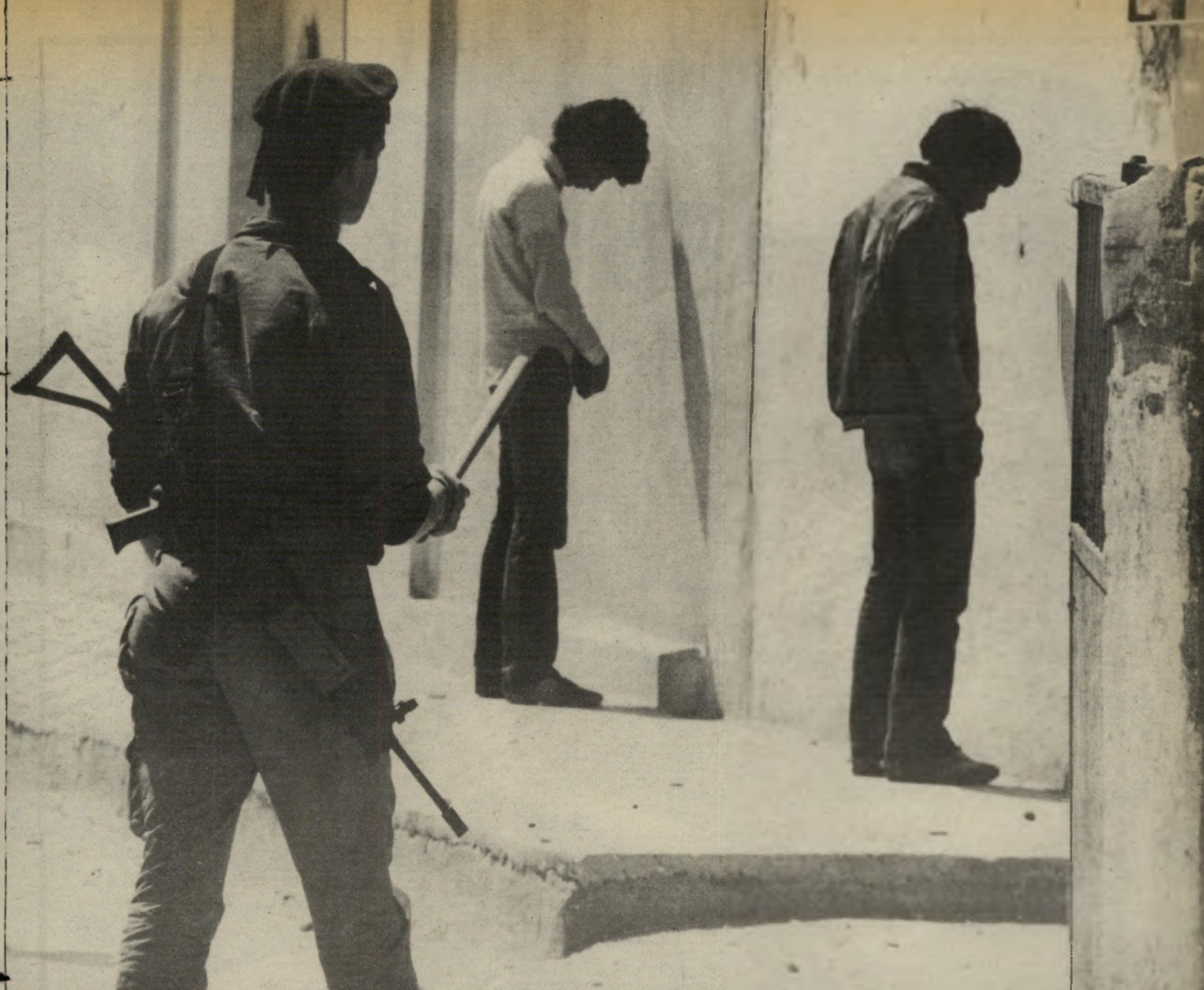
חייל שומר על פליטים ממחנה קלנריה