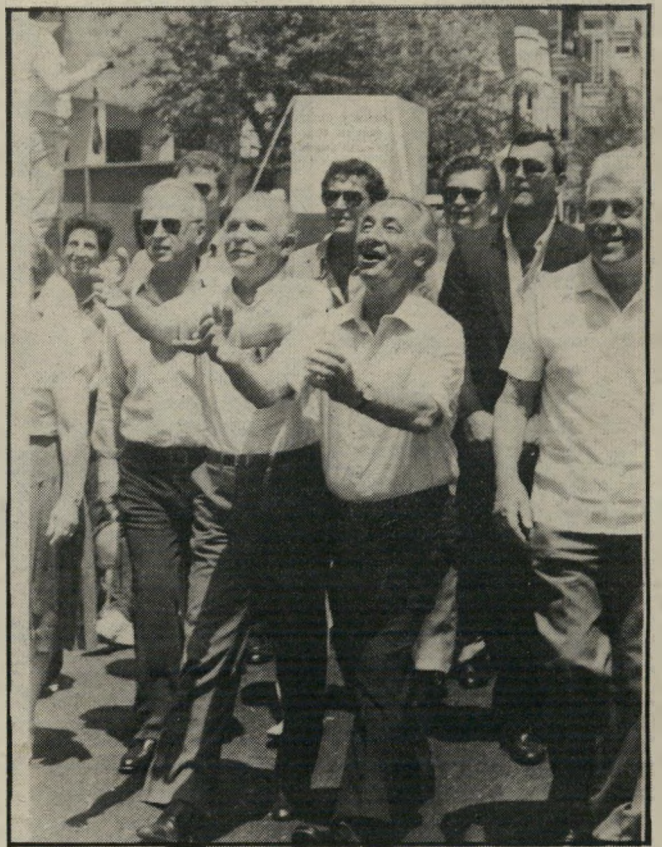
צמרת המערך במיצעד ה'1 במאי

● משמאל למטה: מישמרת-האבל הספונטנית, שהתכנסה בכיכר מלכי-ישראל בתל-אביב, מייד עם היוודע דבר רצח אמיל גרינצווייג. בחזית התמונה נראית אבוקה אחת, כשברקע אבוקות נוספות ושלטים. שלט גדול הנושא את שמו של אמיל, נראה במרכז התמונה, ונרות-דולקים רבים מוצבים על המרכה.