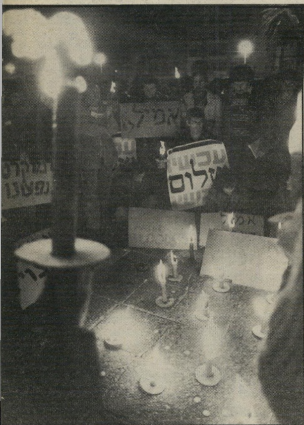
ציון צפרייר: מישמרת אבל לאמיל גרינצוויג