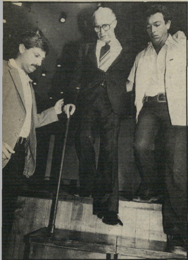
ענת סרגוסטי: מנחם בגין יורד מהבימה

ב גיליון ראשיהשנה הזיג העולם הזה את תצלומי השנה של טובי צלמי-העיתונות בארץ. השבוע מבקש העולם הזה להראות כי לא תמיד הסנדרלים הולכים יחפים, והוא מציג על פני העמודים הבאים, את תצלומי השנה של צלמי העולם הזה.