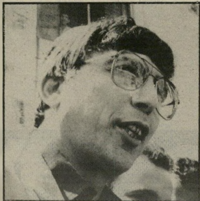
אהרון אבו-חצירא: מאסר בפועל

מאחר שכך נתמצו הערכאות המישפטיות, אין עוד אפשרות לטעון כי השר לשעבר הוא הן-משפט.