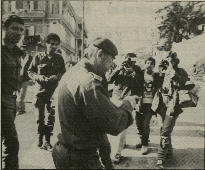
רמטכ"ל רפאל איתן יוצא מבית-הדין הצבאי ביפו

ב חודש אדר זוכו רס"ן רודי מופז ואחרים מפקודיו, שנאשמו בהכאה ובהתעללות בסטודנטים וילדים בגדה. המישפט, שנערך בבית-הדין הצבאי ביפו, הפך לאחר המישפטים החשובים כמדינה. הוא החל כמישפט שיגרתי נגד קצין אלמוני וכמה חיילים,