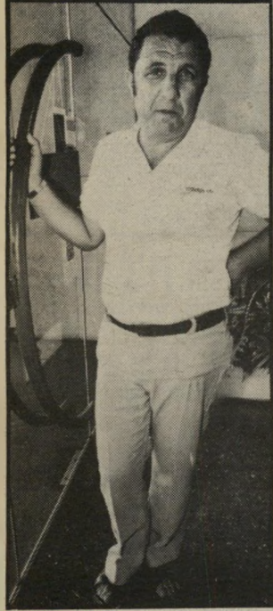
קצין-ביטחון אקרמן הישרים וההגונים משלמים

אנשים סוחבים כי הם רוצים להגיע לרמת החיים של השכן. עד כה נתפסו במשך השנה הנוכחית 250 גניבות. יש לנו עשרות קציני-ביטחון. גם האמ צעים האלקטרוניים שהיכנסנו עוריים כפיקוח. היום, כשרוצים לגנוב כגר, ייכים להתוך אותו, אחרת יומזם הומם המוכר אליו כשיוצאו אותו מהחנות. אבל גם זה לא עוזר, כי גונבים מוצרי קוסמטיקה, וכל פריט קטן יכול לעלות מאות או אלפי שקלים.