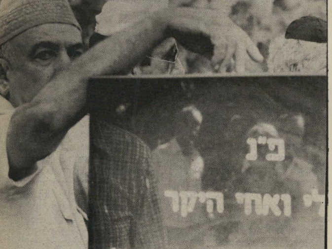
יגאל הורביץ שר-האוצר לשעבר הופיע ללא כיפה, אלא בכובע-טמבל. הוא אחד מאנשי המימסד הבודדים ששמרו על ידידותם לשייקה ירקוני במשך כל שנות הנמלה.