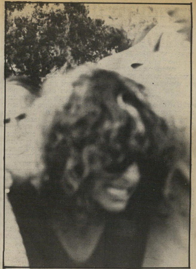
זעקת בת רותי, נתנה ביטוי ליגונה בבכי עז. שהידהד ברחבי בית-הקברות. גדוש קרובי מיסמחה וידידים - אותם ששמרו אמונים.

אף אחד לא עקר הרים כשבילו ואבא לא ידע להילחם את מלחמתו בעצמו. אנתנו מודות למעטים שהיו איתו בשנים האחרונות.