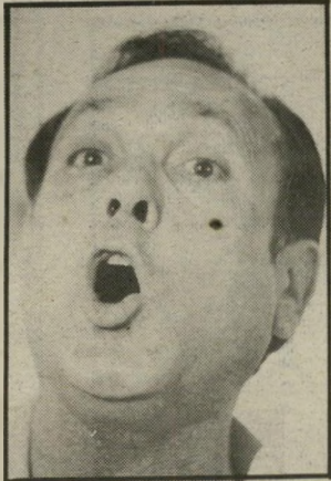
מועמד מודעי נצחון בממשלה

הוא שר-האוצר יורם ארידור. בהתקרב הימים הנוראים נראה, כי ימיו במישרתו הם ספורים. אך את מחיר הפסטיול של השנתיים שעברו נשלם עוד זמן רב אחרי שיתפטר.