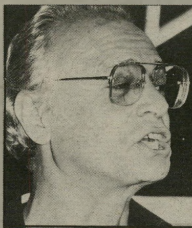
סופר קישון דבר מה רקוב

למיקרא כמה מהדברים שכתב קישון, באותה תקופה, אין לי ספק, שהוא מתעלה בערכו, על-