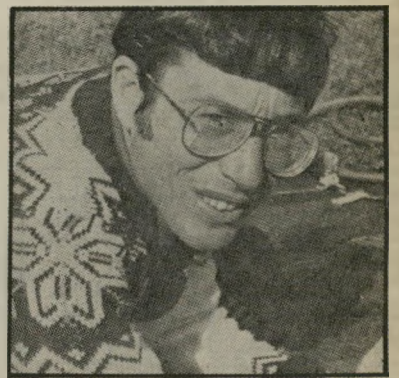
סופר המאירי הנוף והילדים

כיום של בנייה-זוג לכפר, מעורר תקווה. אילו היו באן יותר אנשים כמוכם, צעירים, רציניים, שגמרו אוניברסיטה וכל זה, היה הגליל נראה