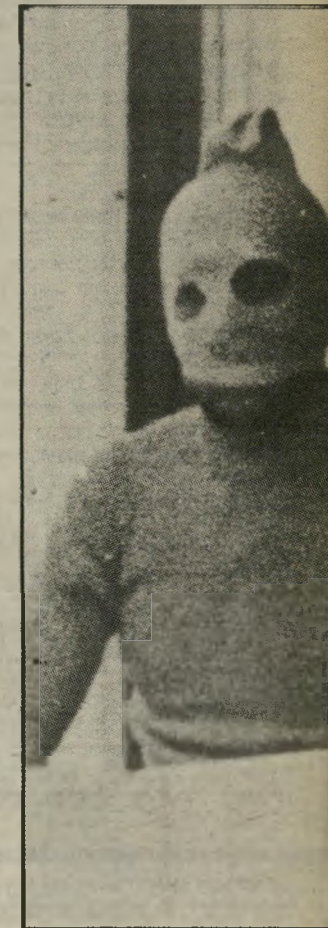
יוסף נואל, המכונה 'סיכה' טוני וצ'ה גוארה, ממקד מיבצע איקריט ובירעס."

סרט שיוקרן ביום הראשון הבא, ה' 4 בספטמבר, ייחשפו לראשונה לעיני הצרי