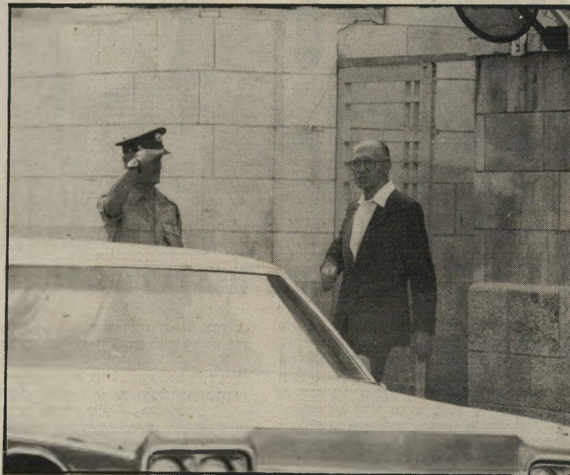
ראש-הממשלה מנחם בגין יוצא לדרך

במצודת זאב מדברים במשך חודשים על שתי שערוריות הקשורות בשני מישדרים ממשלתיים המאיישים עליידי אנשי חרות. פרשה אחת קשורה למישרדהתיקשורת ופרשה