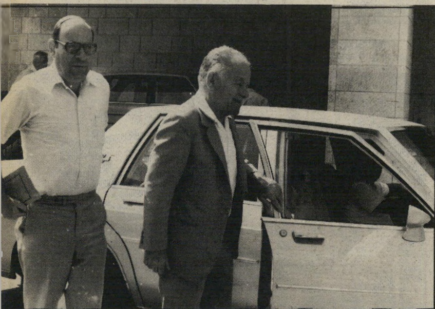
שריחוף יצחק שמיר וסגנו יהודה בן מאיר

מזה חודשים אין קשר בין הרמטכ"ל היוצא וראש הממשלה. אך בשבועות אחרונים התחילו אנשים שונים ליצור את הקרקע לקשר ראשוני, בלתי מחייב, בין השניים. רפול אומנם הודיע חרי"שמעית שהוא חושב על הקמת גוש לאומני חרי"פירלמנטרי, אך מקורביו אינם רואים בכך סוף פסוק.