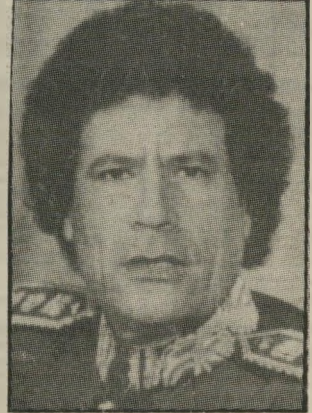
קדאפי לא מאויש

בחלפים. אם נניח שהלובים מצליחים לאייש 50% ממטוסיהם, פירוש הדבר ש-150 נמצאים באחסנה. גם בסוריה נמצאים 5%-10% מן המטוסים באחסנה. פירוש הדבר שמול חילה-האוויר הישראלי, שכל מטוסי פעילים, עומד