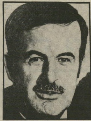
אסד נשק מזרחי

מתוך כמות מטוסים זו חלק נמצא באחסנה, בין אם בשל מחסור בצוותים ובין עם עקב מחסור בחלפים. במצריים נמצאים, על-פי מקורות זרים 300 מטוסים באחסנה, בעיקר עקב מחסור