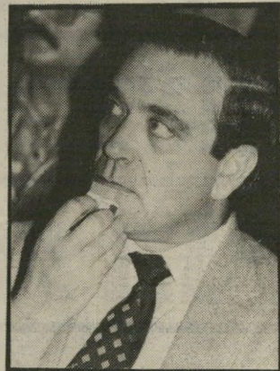
פת לא בעדינות

● יש להניח שרוב הטנקים החדישים, כמו טי-72, נמצאים ביחידות סדירות, כך שבמקום טנק טי-72 מושמד יבוא מן המחסנים טנק מיושן יותר, כמו טי-62 או טי-55.