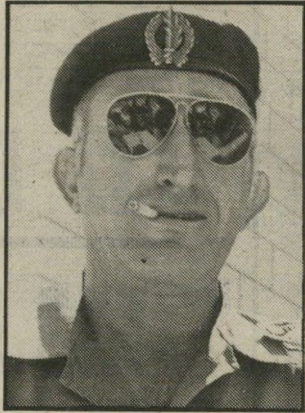
לוי נשק מערבי

הרבר נובע מיחס היפגעות הטנקים בין צה"ל והערבים. על-פי מקורות זרים, הושמדו במלחמת יום הכיפורים 2000 טנקים ערביים, לעומת 400 של צה"ל. זהו יחס השמדה של 5:1. יחד עם זאת, יש להניח שיחס ההיפגעות הוא קטן יותר לטובת הערבים, שכן חלק מן הטנקים של צה"ל שנפגעו במלחמה