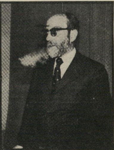
מחבר-מיתחנים באגלי עד לצה גווארה