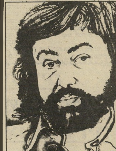
סופר בקר שילטון העבדות הרוחנית

סיפור המעשה עוסק בתמרדותו של המורה זימורק באותה עבודת-דוחנית. וימרוק נוטש את אשתו, המייצגת את השיגרה (אני חושב ביצד לשנות את חי מן הסדר. אומנם, עריין הסרה לי ההבדלה הסופית ). השינוי הגדול בחייו מתחיל, כאשר הוא אומר לתלמידיו כי להפגנת האחד במאי אין חייבים לכוא. יקחו בה חלק רק אותם הרוצים לכוא. התוצאה: כירור מישמעתי. בכחות השכחות הוא פוגש כאלס-דיקורים, באנתוני קראם , הצעירה ממנו. כעבור שבועיים הוא עובר להתגורר בדירתה, ועד מהרה הוא מגלה כי היא האשה הדיאקונינית ביותר ששכב עמה בזמן מלחמת העולם השני . בהמשך חיפושיו יוצא וימרוק בעת חופשתו לעבוד כמחלק עוגות ולחם חנוניות, תחת לעבוד עבודה שיכלית, כמינהג המורים במזרח אירופה. בחדש השני של החופשה נסעו וימרוק ואנתוניה לחופשה בהונגריה, שבמהלכה נסתה אנתוניה להימלט אל המערב. וימרוק שב ללמד בבית-הספר, עד שאחד ההורים מתלונן עליו, על שאלץ את אחד מתלמידיו לקרוא בכיתה כקול רם את שירו של ברטולד ברכט בשבחי הספק. והוא ננזף. אנתוניה נדונה למאסר ווימרוק מחליט להמתין לה. הוא מפוטר