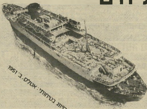
סיווג בטוחות: אטלס. ב. 1951

שייט באונית פאר, נוף מרתק של מים ושמים, 6 ארוחות ביום (גם מזנון חצות), סיפוני שיזוף, קאזינו, סאונה, 7 סיפונים, קוקטיילים, דיסקוטק, קולנוע, שעורי התעמלות, 3 בריכות שחיה, בינגו, תזמורת, צוות הווי, נשף תחפושות, משחקים, חנות פטורת-מכס, מספרה מיזוג אויר מלא בכל התאים.