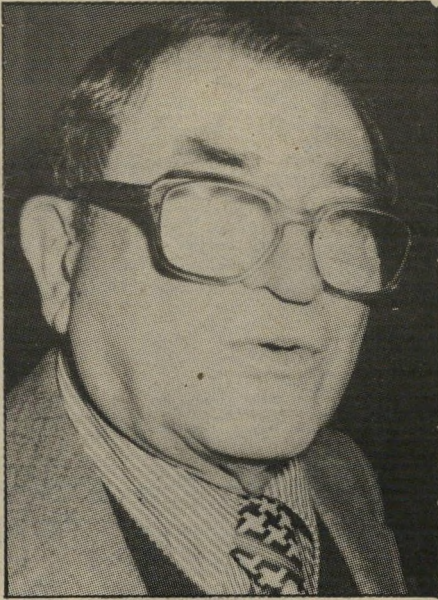
פורש שילה - תככים