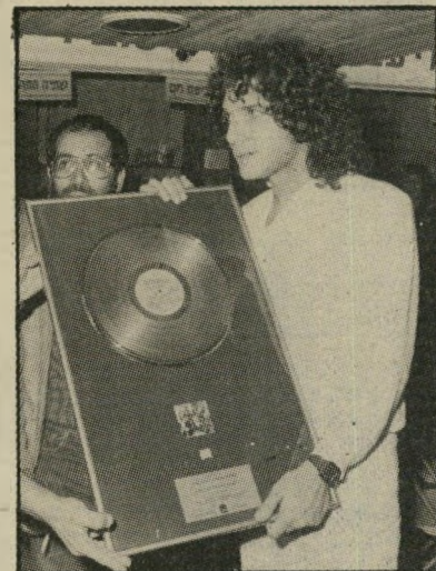
שחקן מוסיקאי קוררי תקליט זהב

● ישראל משתלבת במהירות בתעשיות בינלאומיות. גם תעשיית המוסיקה המקומית