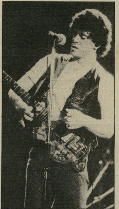
מוסיקאי ריד בלי סמים ומשקאות חריפים

בשנות השבעים היה לו ריד הנציג המושלם ביותר של מוסיקת המחתרת האוונגרדית, המתקדמת, המופרעת והיפה ביותר של ניו יורק המטורפת. ריד המציא סגנון אשר כונה "אוונג' פאנק". הוא הלחין ושר בלהקת מחתרת הקטיפה המצויינת ורעינותיו שימשו כסיס רחב לפאנק ולגל החדש שנוצרו בסוף שנות השבעים. התמונה הושלמה אז בהופעות באיסט וילג' ובמופע המריה המעורבת של אנדרי וורוול. נושאים כמו פרברטיות, ייאוש ומוות לצד תקליטים דוגמת מחתרת הקטיפה עם ניקו ו-LOADED - (ועם השירים גיין המתוקה ורוק'נרול הם קפיצות ענק ברוק האמריקאי ניו יורקי. בתקליטי הסולו שלו המשיך ריד לעסוק בהומורסכסואלים, בטרנסובסטיטים ובישימוש בסמים. הופעותיו היו מהממות ומכארת.