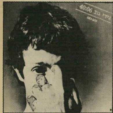
כמו במילים של טוב שבת (את איתי/ילד קופץ בי כשאת איתי/בחי...")

זה אינו נאמר לשלילה. התקליט כולל הקלטות בתיבות של בני משפחת גרוניך ומשפחת לוי לצד שירי השניים, שהוקלטו באולפן. "שמי ושלמה" מציגים למעשה קישקושים שונים, מקצועיים יותר או פחות. חלק מצדדים חן וחלק כלל לא. אין חדש ביצירת לוי וגרוניך, זו אינה בעיה לאלה אשר חיבבו את