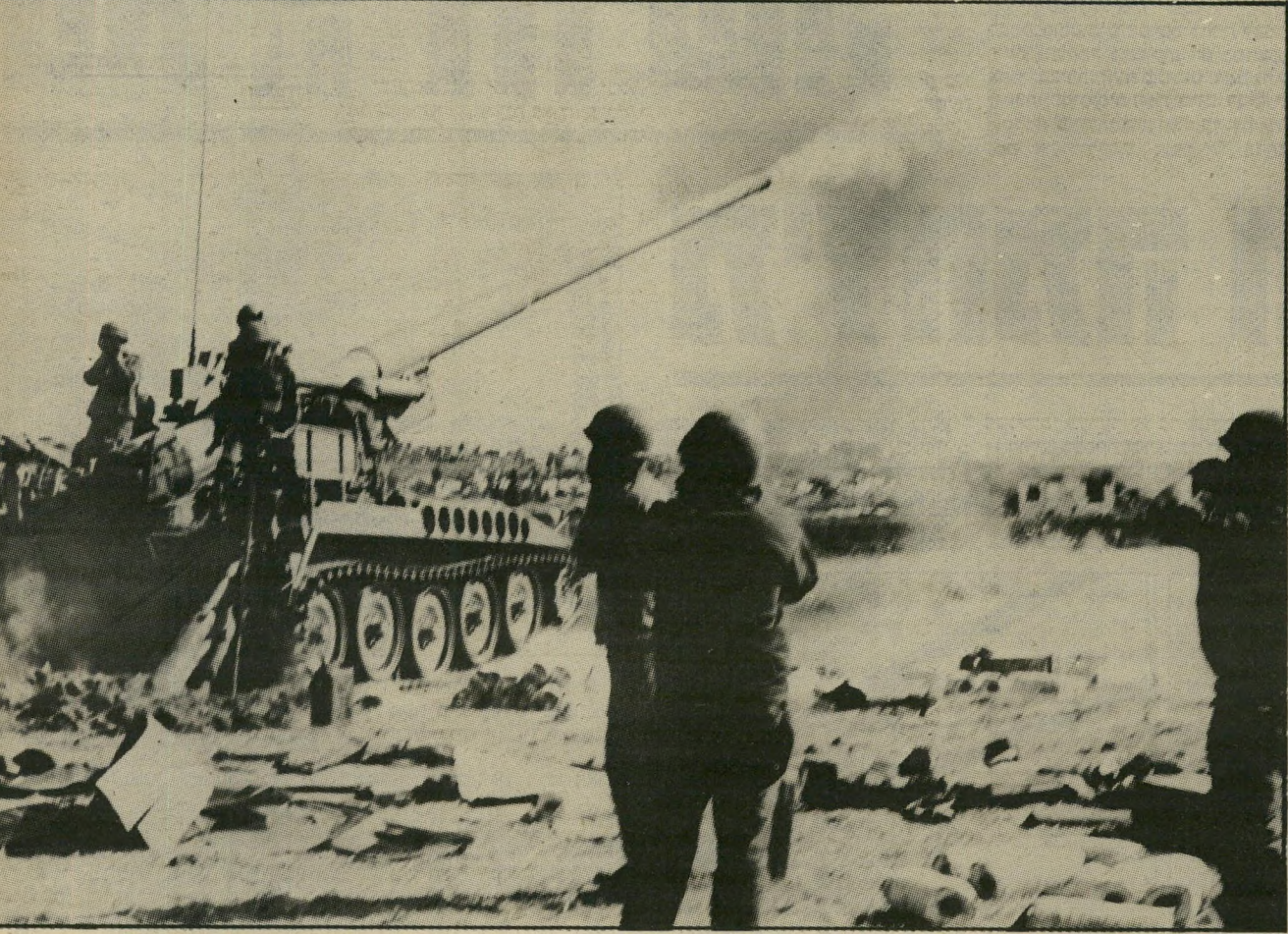
מילחמת יום-הכיפורים ברמת-הגולן לקבל מידע על הטילים הסובייטיים

למעשה אין סכנה זו סכירה. בצד הסורי יש פיקוח חמור על כל המהלכים מטעם מיטטר דיקטטורי, שאין אצלו חוכמות. גם כוחות אש"ף משולבים לגמרי בשרשרת-הפיקוד, ואיש לא יפעל שם שלא על דעת השלטון. גם אילו אירעה תקלה, ופעולה