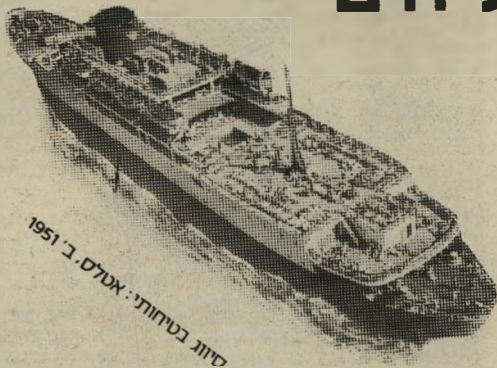
סיגו בטיחותי: אטלס ב-1951

שייט באונית פאר, נוף מרתק של מים ושמים, 6 ארוחות ביום (גם מזנון חצות), סיפוני שיזוף, קאזינו, סאונה, 7 סיפונים, קוקטיילים, דיסקוטק, קולנוע, שעורי התעמלות, 3 בריכות שחיה, בינגו, תזמורת, צוות הווי, נשף תחפושות, משחקים, חנות פטורת-מכס, מספרה מיזוג אויר מלא בכל התאים.