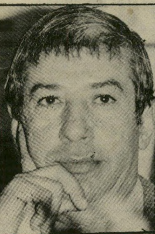
קורא ותד שיחות טלפון

ובכן, לא סירבתי להיפגש עם סרטאוי. ניהלנו כמה שיחות-טלפון, במטרה לארגן פגישה באירופה. אין ברעתי לגלות כשלב זה את פירטי השיחות, אך דבר אחר אומר: לא