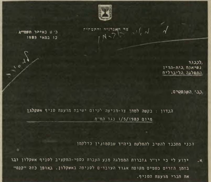
לכבוד נשיאות, בקת-הדין המפלגה הליברלית