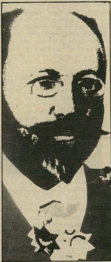
מתיישב שייך נסיונות אונס בראשי-פינה

בסיפרה הנהדר גיא אוני, מספרת שולמית לפיד , על גיבורת סיפרה סאניה סילס , הנכנסת