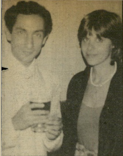
כורנגן ארדיס וכתבת-ספורט מיגרש מלא נשים

תענוגות התא האינטימי אינן בהישג ידו של כל אהד כדורגל. אלא אם כן יש באפשרותו לשלם את הסכום הצנוע של 30 אלף לירות שטרלינג למינו של שלוש שנים - כ-15 מיליון לירות יש-ראליות!