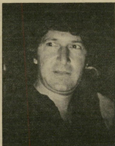
מנהל-קבוצה ז'רז'בסקי שירותים יקרים

למה לחבריו אסור להגיב על מסקנות הדו"ח, דבר שאין אוסרים על הוד? נשאלה דוברת הלשות. היא משיבה בטבעיות: "אחרי שהודח מתפקידו, פנו אליו כלי-התיקשות. האדם הזה נפגע, נעשה כלפיו מעשה קשה, וחשוב היה לו להוציא את כל הכעס שלו". הסבירה הדוברת. הוד אמר כל שרצה, חבריו חורקים שיניים וממלאים את פיהם מים. היחסים העכורים הולכים ומתעמקים. לדבריו של הוד, יחסים אלה הם שהביאו להדחה.