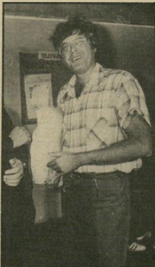
תובע אופי צויעיכוב יציאה