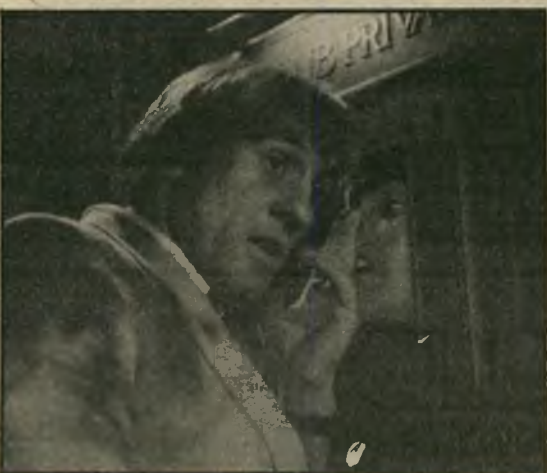
ז'ראר דפארדייה: לדבר דרך האף

אמנם, ההמצאות הקומיות של ובר אינן מבריקות או מקוריות תמיד. העלילה, שבה קשורים גאנגסטרים ממכסיקו, שוטרים מושחתים ויצאניות רודפות-בצע, נראית יותר כאילתור של רגע מאשר סיפור בנוי היטב. אולם מי שמחזיק את הסרט הם שני כוכביו, רישאר, בהופעתו המאופקת