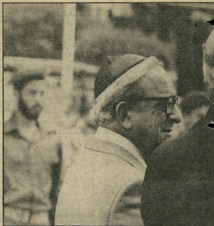
אריאל שרון ויצחק נבון כיפה סרוגה - גוש'אמונים