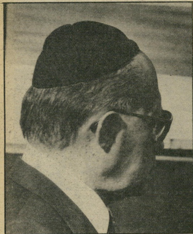
מנחם בגין בורות בשטח היהדות

במי להתחשב, כשהמנוח היה חי, לונג, כופר וגלוי-ראש בחייו.